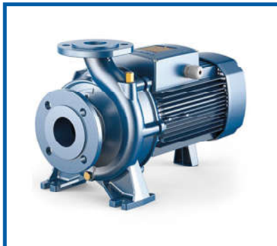
Máy bơm nước / Water pumps