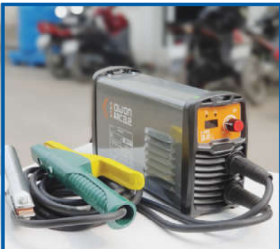
Máy hàn cơ khí Mechanical welding machine

Currently, with the development of science and technology, the machinery and equipment serving the construction and installation of Vạn Thành An is invested by leading domestic and foreign manufacturers.