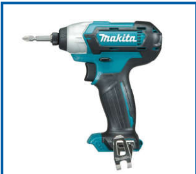
Súng bắt vít / Screw driver