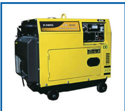
Máy phát điện Generator