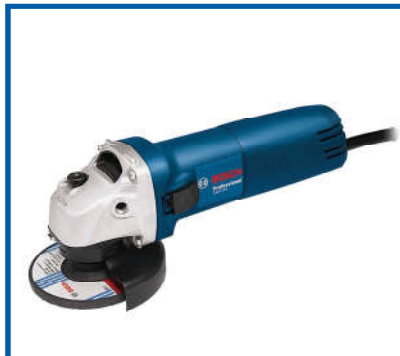
Máy cắt cầm tay Hand-held cutting machine