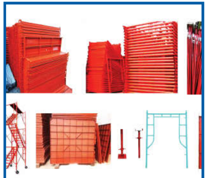
Cốp pha / Formworks