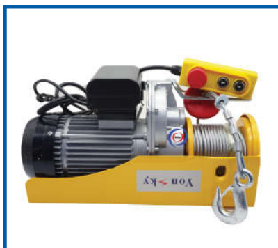
Máy tời / Winch