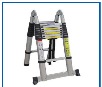
Thang chữ A / A ladder