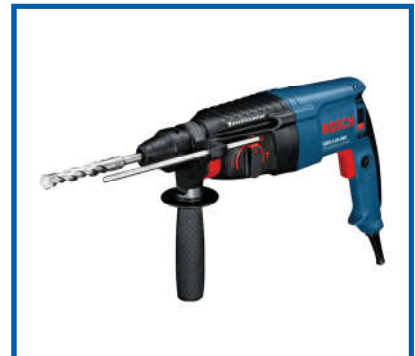
Máy khoan / Drill